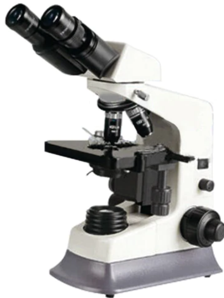
Imagen nítida y brillante con objetivos de alto contraste CF

Una forma agradable, un sistema óptico excelente y un equipo flexible te hacen disfrutar del trabajo. Es un instrumento ideal para la biología, bacteriología, inmunología y farmacología.